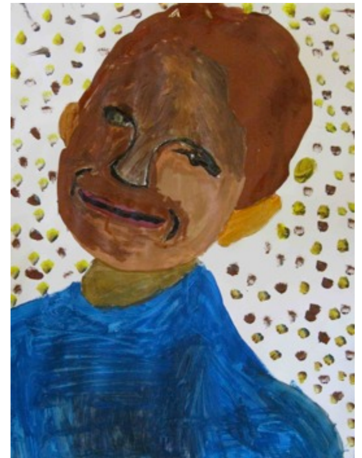
Mise en peinture et grand format