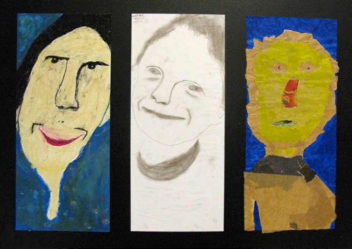
Assembler, associer, donner sens